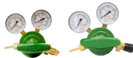
· YR-70 Jr. (Oxygen)