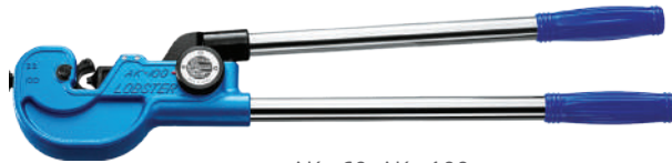
AK - 60, AK - 100